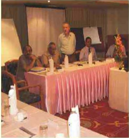
blnkj dk; ' k y k e s l o g d k; l

17% 'xqlokk ru; f.k o vly l k e x r f k d k; d h t i p o d s l e k v l h u d m i d j. M a, o s v l h u d f u e k k r d u d h d s o k j s e s v l k d f o l r r i f k k k i n k u d j k; k t k, A